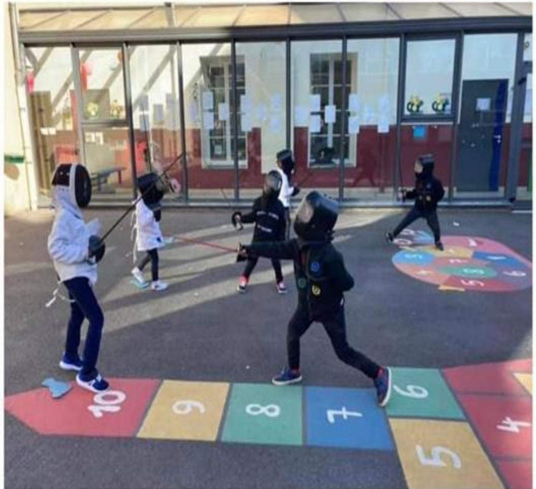
Plus de 1 000 élèves ardennais ont découvert et pratiqué l'escrime dans leur établissement durant la saison 2020-2021.